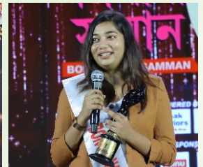
Banga Nari Samman