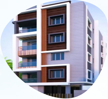
NEWTOWN - AAIB/227 2.24 KATHA - INDIVIDUAL PLOT