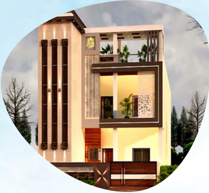
HARIDEVPUR 2 KATHA - INDIVIDUAL PLOT