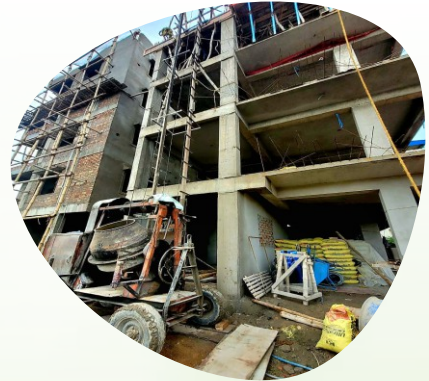
NEWTOWN - AAHC/2058 3 KATHA - INDIVIDUAL PLOT