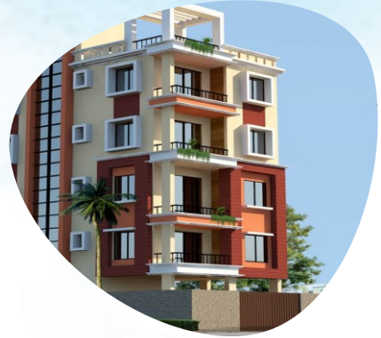
NEWTOWN - AAIB/371 3 KATHA - INDIVIDUAL PLOT