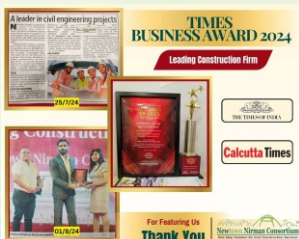
Times Business Award