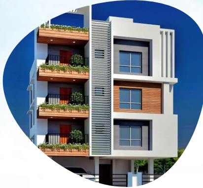
NEWTOWN AAIDD/221 2.24 KATHA - INDIVIDUAL PLOT