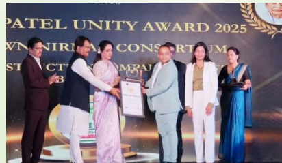
India News Sardar Patel Unity Award