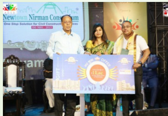
WB Govt. Consumer Affairs Leadership Award