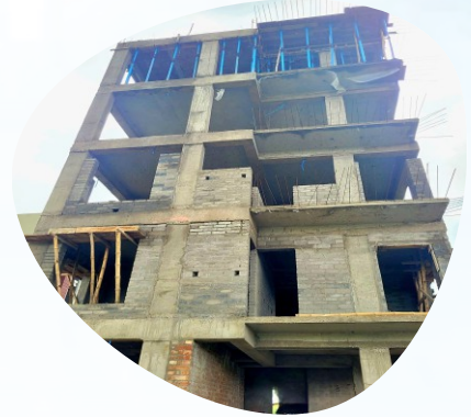
NEWTOWN - AAIC/2325 2.24 KATHA - INDIVIDUAL PLOT