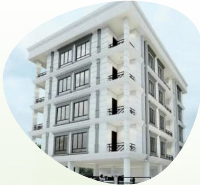
NEWTOWN - AAHC/1725 HIG CO-OPERATIVE PLOT